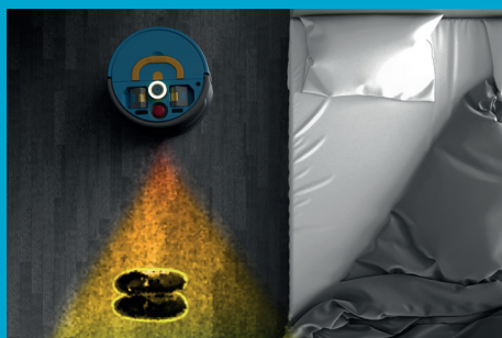
レーザーナビゲーションとセンシングで高い精度を誇る