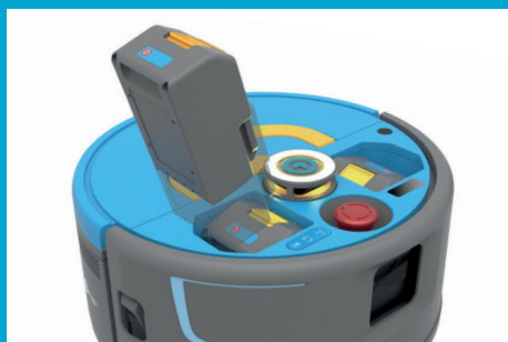
充電式で交換可能なバッテリー