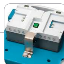
オンボード充電器

ゴミ袋/リネンバッグを追加 長いハンドルに ゴミ袋またはリネンバッグを 追加できます。